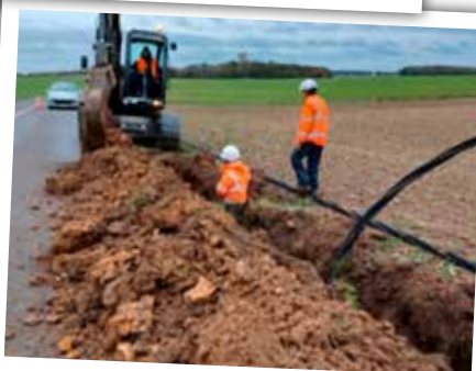
Enorme câble enterré de Jouy à Egreville