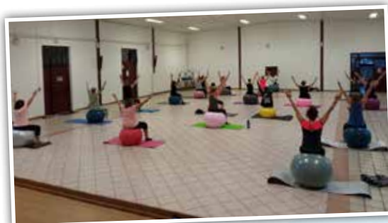
Cours de gros ballon