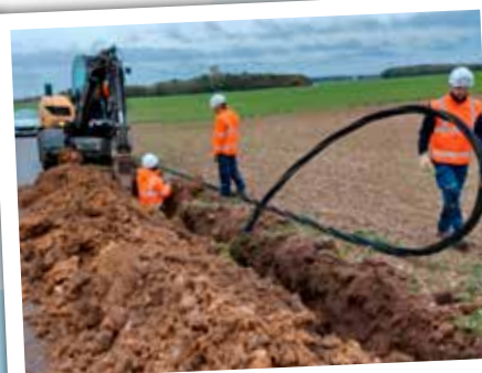
Travaux indispensables au développement de la zone d'activité du Bois des Places