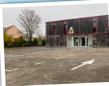
Parking public du Dock du rire rue Edmond Hubert

L'équipe municipale vous remercie de votre compréhension.