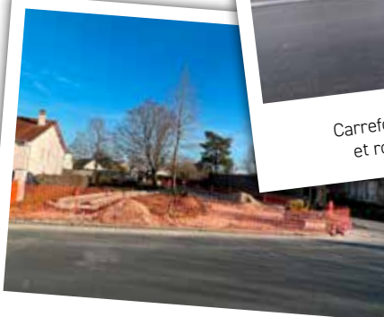
Élargissement du carrefour rue René Maisonneuve