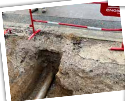
Merci à INEO pour la qualité du travail effectué