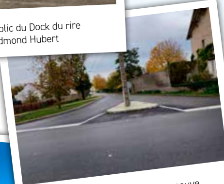
Carrefour rue René Maisonneuve et route de Lorrez-le-Bocage