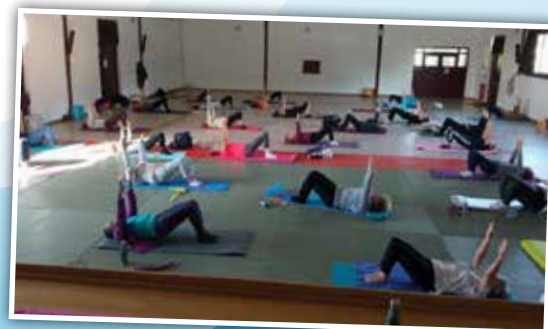
Cours de pilates