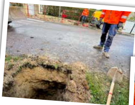
Renforcement électrique d'Egreville travaux rue de la Poterne