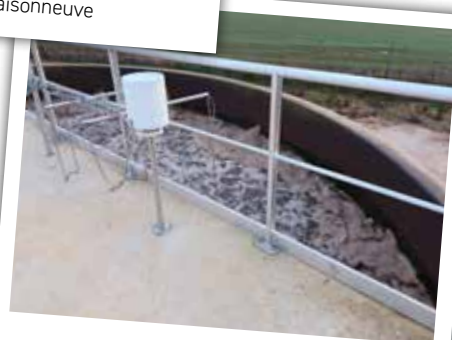
Station d'épuration en fonctionnement