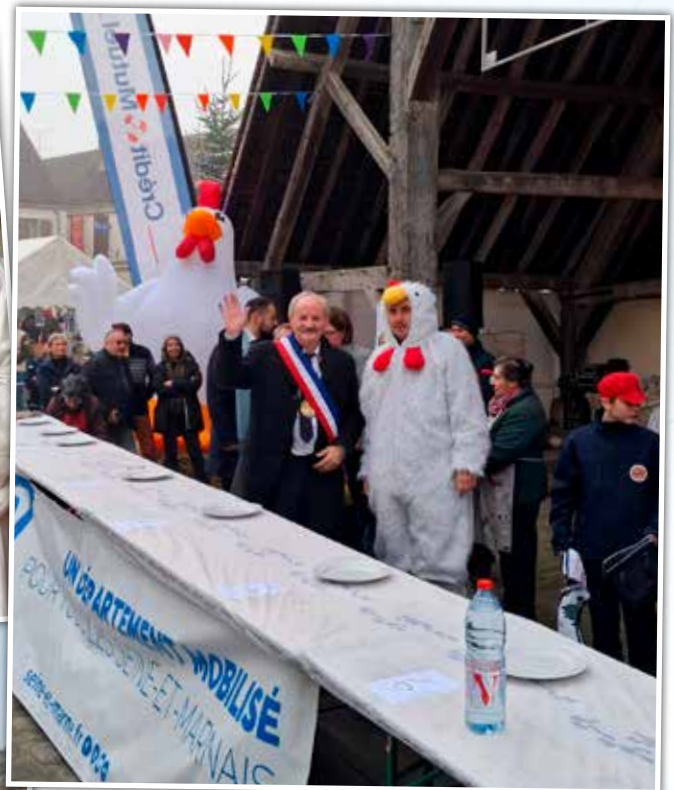
La Foire à la volaille