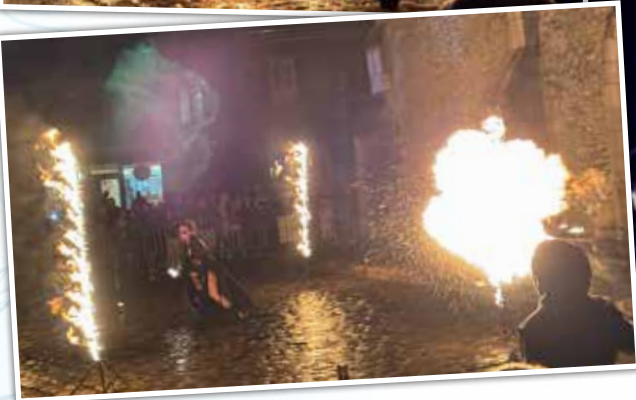
Les cracheurs de feu